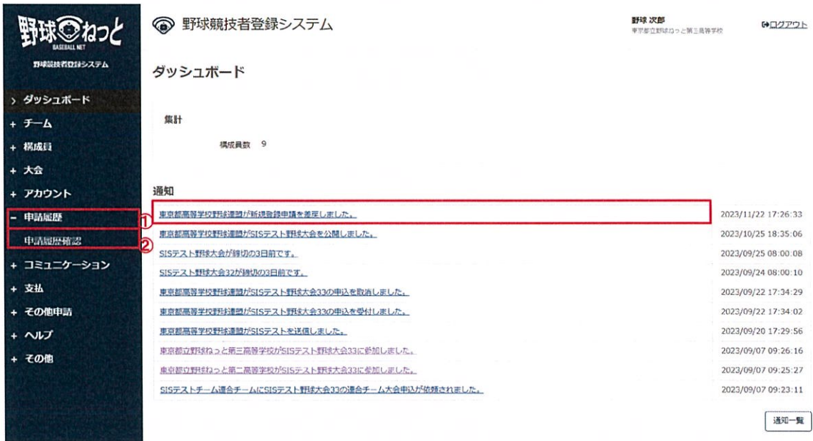
ダッシュボード画面

※加盟団体が差戻しを行うと担当者にメールが届きます。メール内のURLをクリックします。