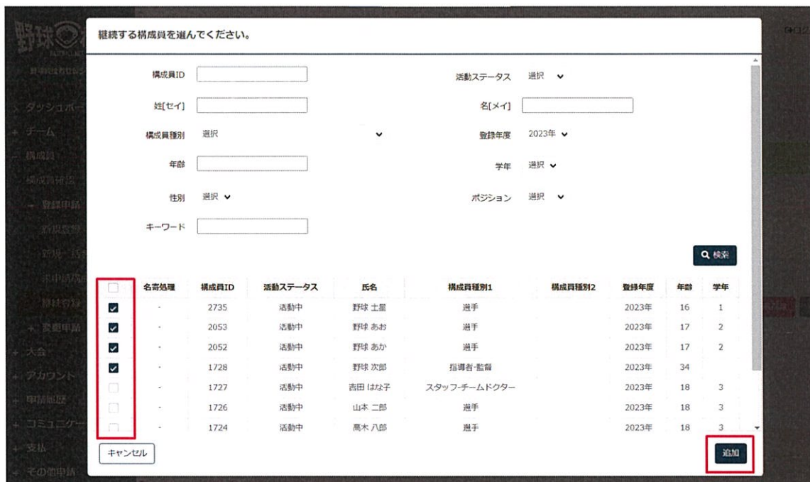
継続対象構成員一覧画面

6) 追加した構成員を申請する場合はチェックを入れ「申請」ボタンをクリックします。