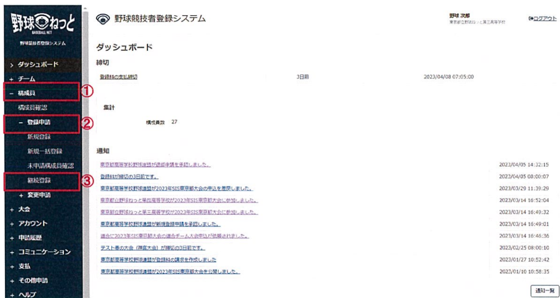
ダッシュボード画面