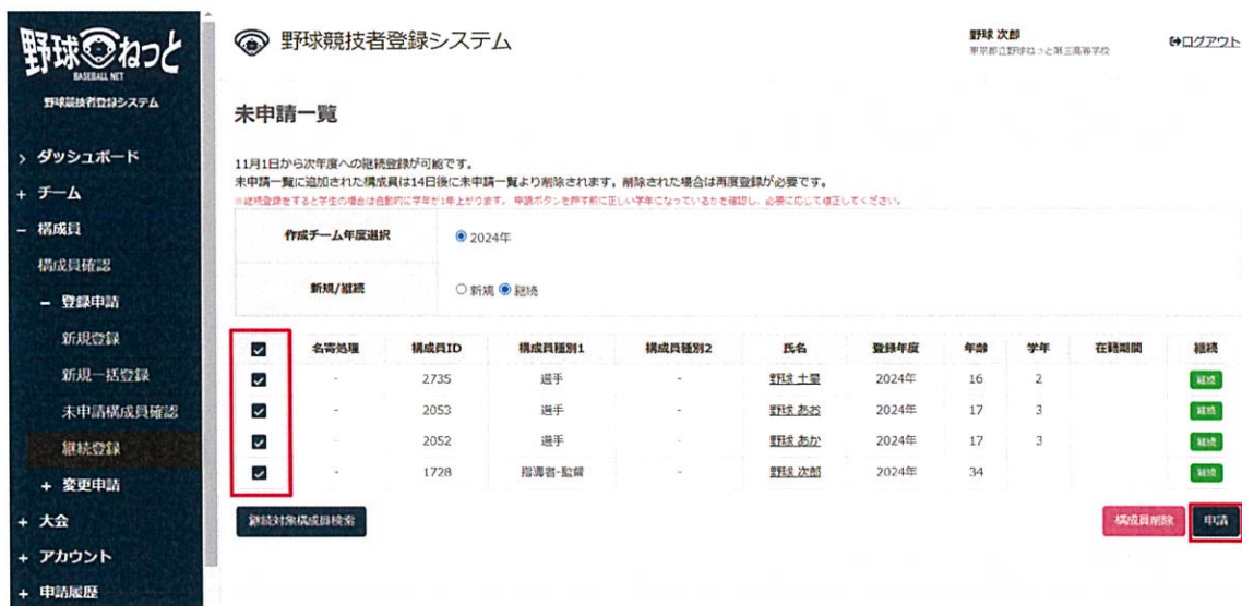
継続対象構成員一覧画面